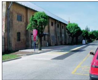
Nové zastávky městské hromadné dopravy se dočkali občané na Letné.

Nové zastávky městské hromadné dopravy se dočkali občané na Letné ve směru k hlavnímu nádraží, kdy za více